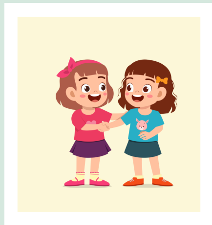
УМЕНИЕ ПРОЩАТЬ И ПРОСИТЬ ПРОЩЕНИЕ