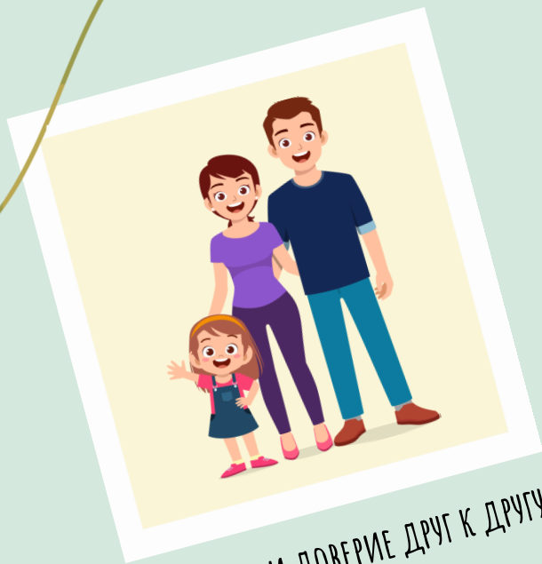
УВАЖЕНИЕ И ДОВЕРИЕ ДРУГ К ДРУГУ