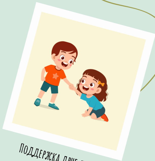
ПОДДЕРЖКА ДРУГ ДРУГА